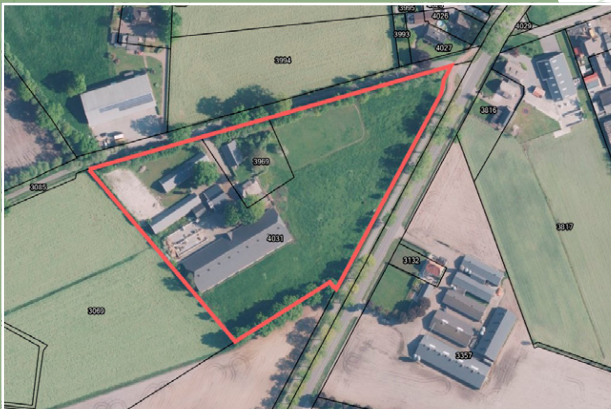
Schematische weergave, aan deze kaart kunnen geen rechten worden ontleend.