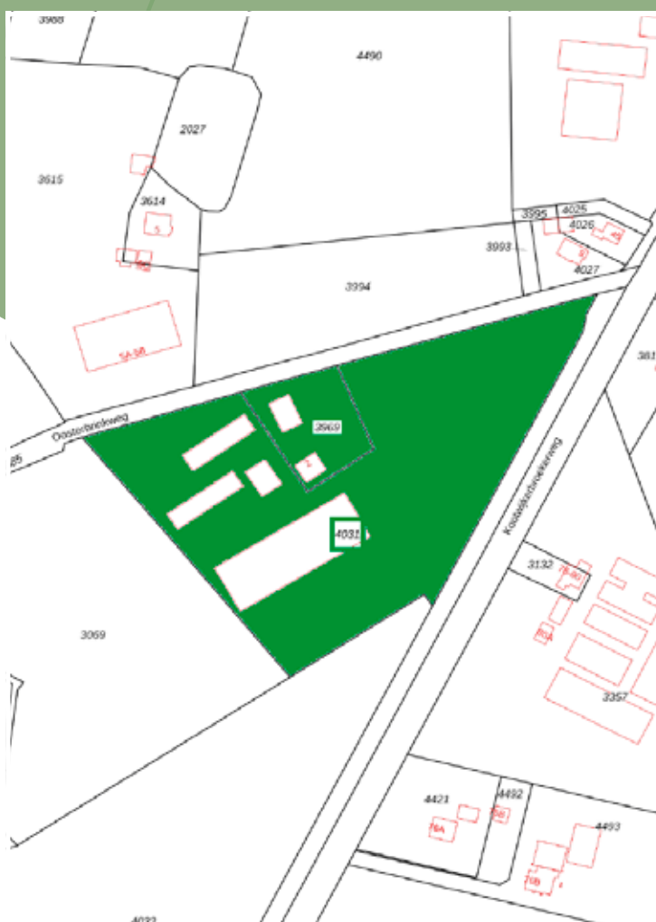
Aan deze kaart kunnen geen rechten worden ontleend.