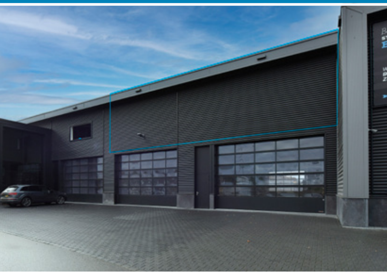
Voorgevel (raamvoorzieningen in overleg)

Multifunctionele ruimte beschikbaar met een bruto vloeroppervlakte van circa 490 m 2 . Het vloeroppervlakte is geheel gelegen op een eerste verdieping en is o.a. geschikt voor opslag of showroomactiviteiten.