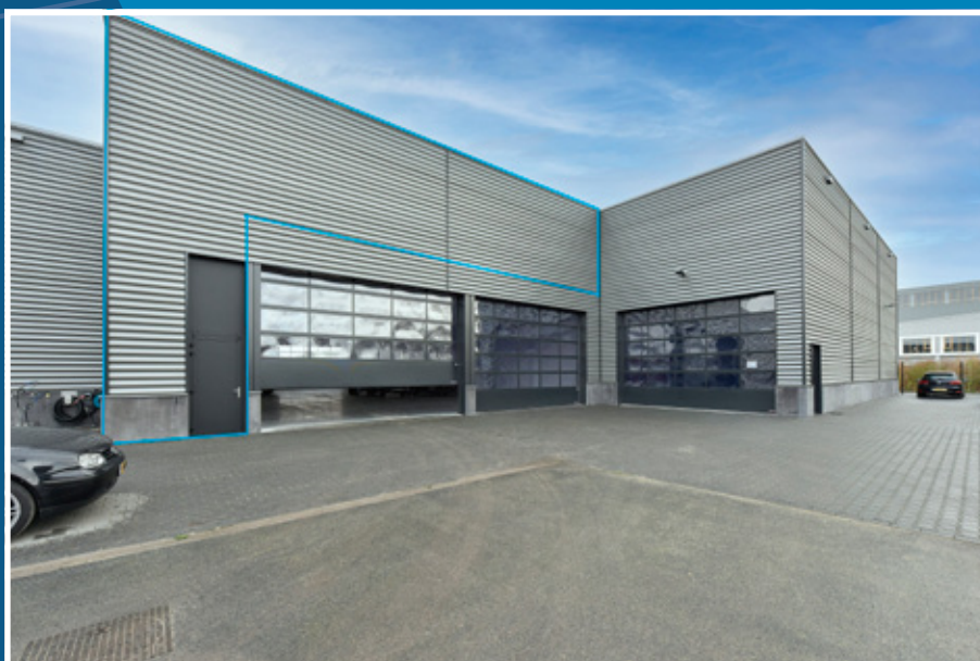
Achtergevel (met loopdeur)