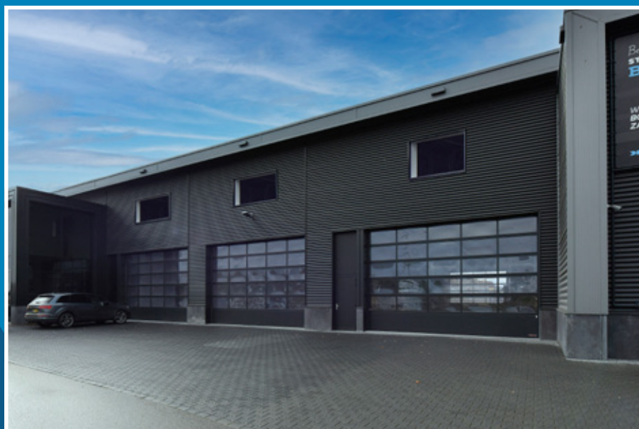
Voorgevel (impressie raamvoorzieningen)