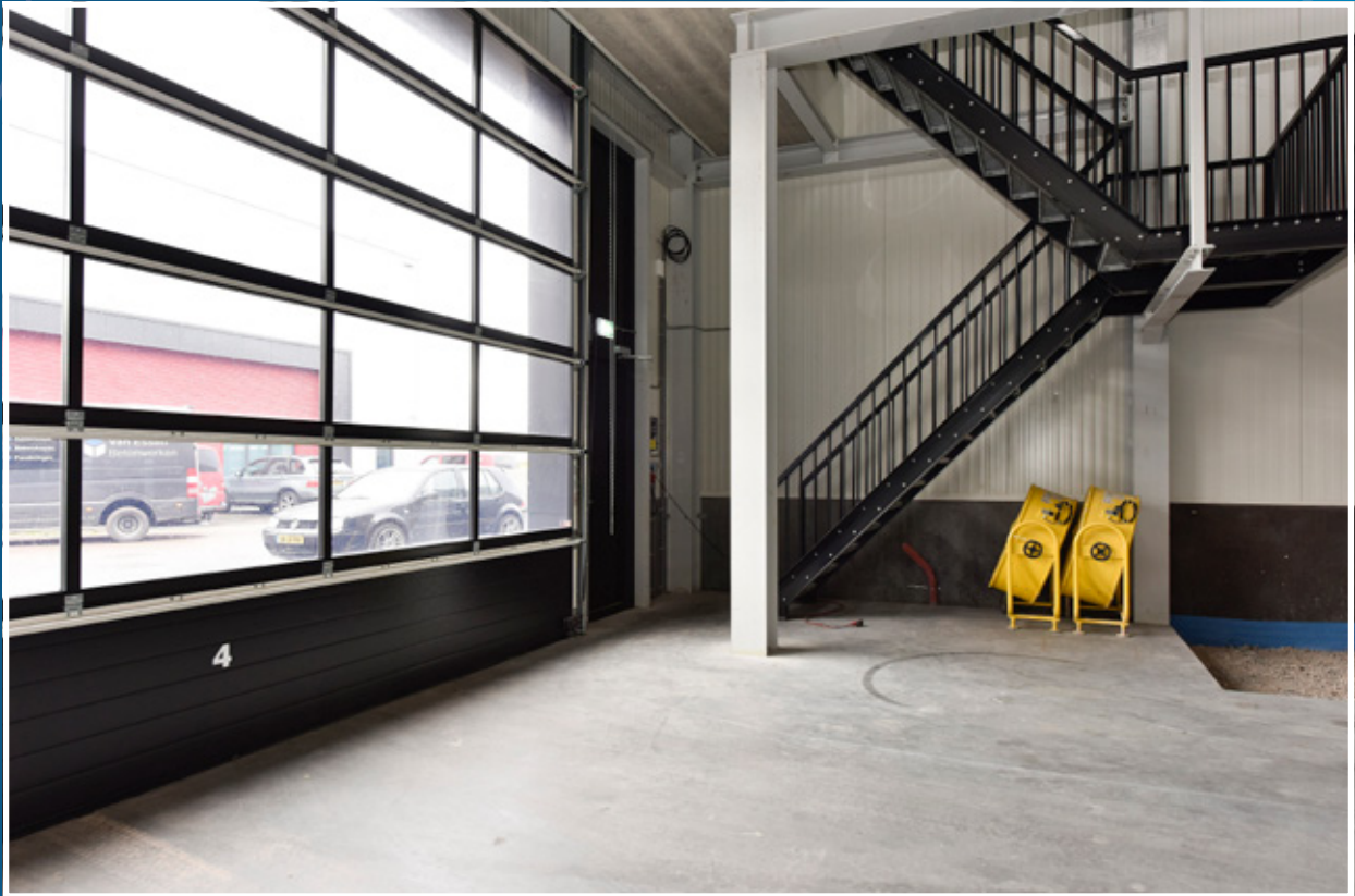
Entree (begane grond)