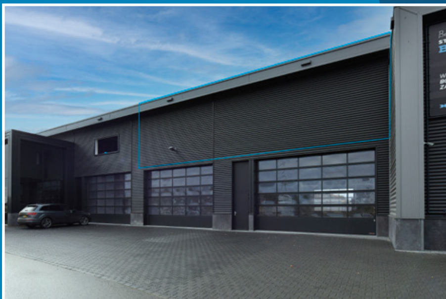
Voorgevel (raamvoorzieningen in overleg)