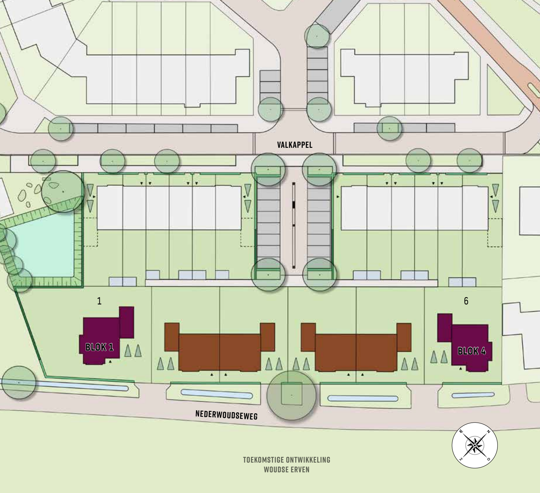
TOEKOMSTIGE ONTWIKKELING WOUDE ERVEN