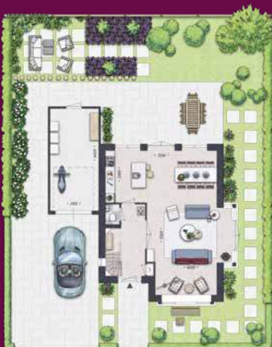
Perceeloverzicht Bouwnummer 6 afgebeeld