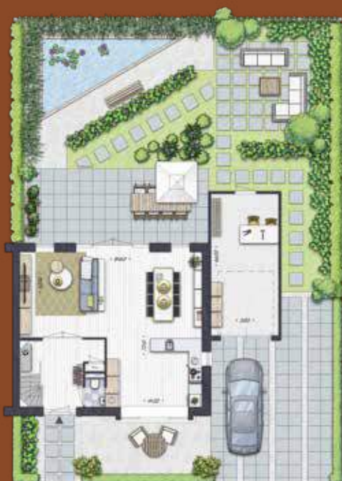
Perceeloverzicht Bouwnummer 3 afgebeeld