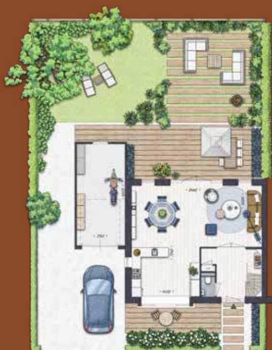
Perceeloverzicht Bouwnummer 2 afgebeeld