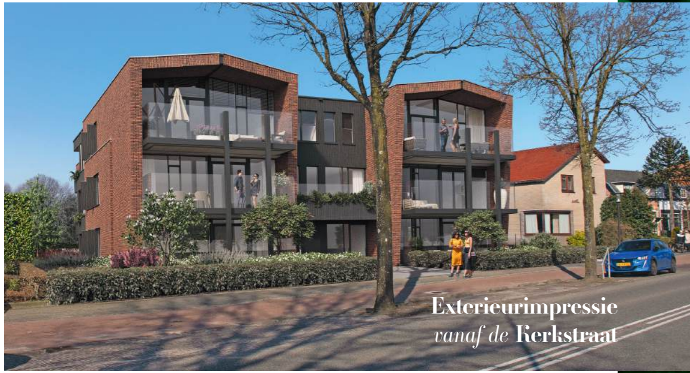
Exterieurimpressie vanaf de Kerkstraat