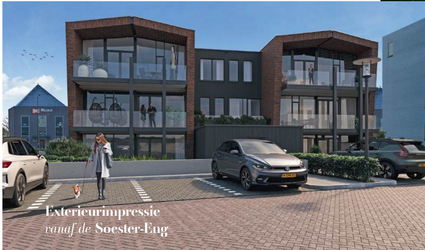
Exterieurimpressie vanaf de Soester-Eng