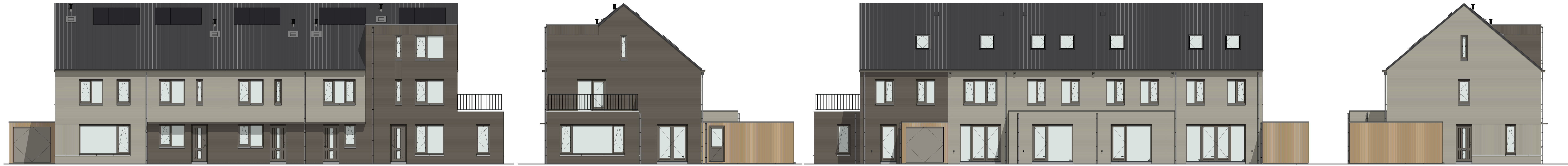
Voorgevel Bouwnummer 15 Bouwnummer 16 Bouwnummer 17 Bouwnummer 18 Bouwnummer 19 Rechter zijgevel Bouwnummer 19 Achtergevel Bouwnummer 19 Bouwnummer 18 Bouwnummer 17 Bouwnummer 16 Bouwnummer 15 Linker zijgevel Bouwnummer 15