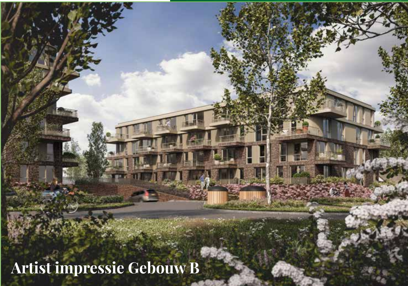
Artist impressie Gebouw B