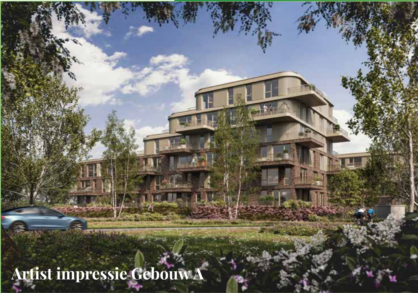
Artist impressie Gebouw A