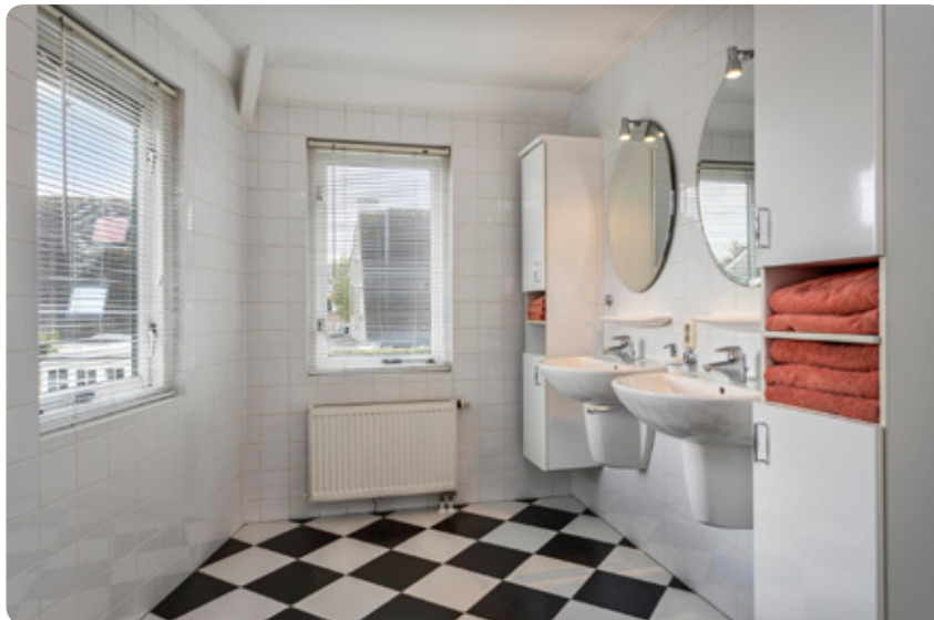
Ruime en lichte badkamer