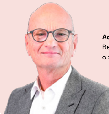
Aart-Jan van Wijncoop RMT Beëdigd makelaar en taxateur o.z.

Dit royale 3-KAMER HOEKAPPARTEMENT met groot dakterras, berging op de begane grond en eigen parkeerplaats is gelegen op een rustige locatie in het centrum aan de zijde van de Koesteeg.