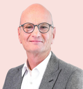
Aart-Jan van Wijnkoop Beëdigd makelaar/taxateur o.z.

Dit royale 3-KAMER HOEKAPPARTEMENT met groot dakterras, berging op de begane grond en eigen parkeerplaats is gelegen op een rustige locatie in het centrum aan de zijde van de Koesteeg.