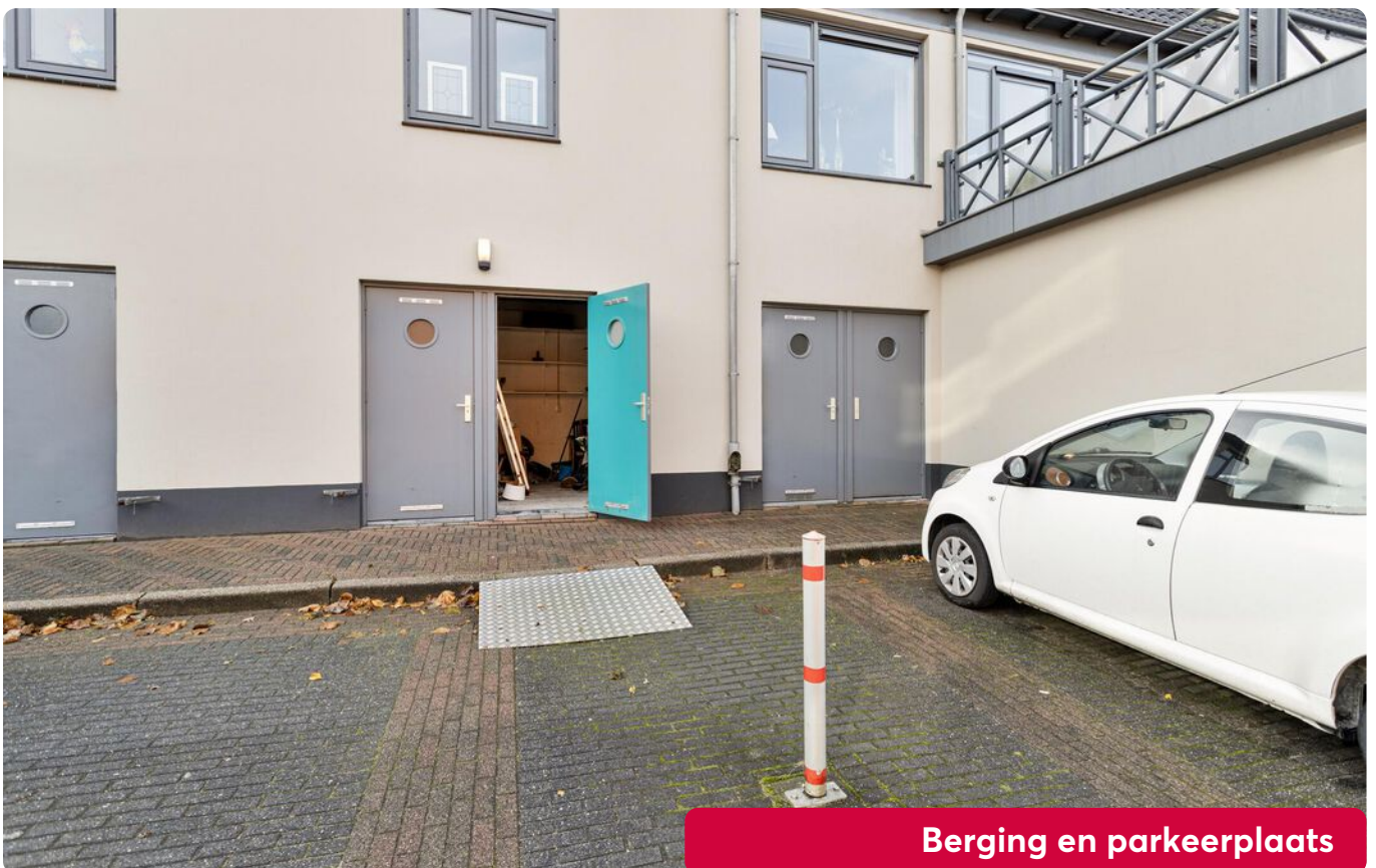
Berging en parkeerplaats