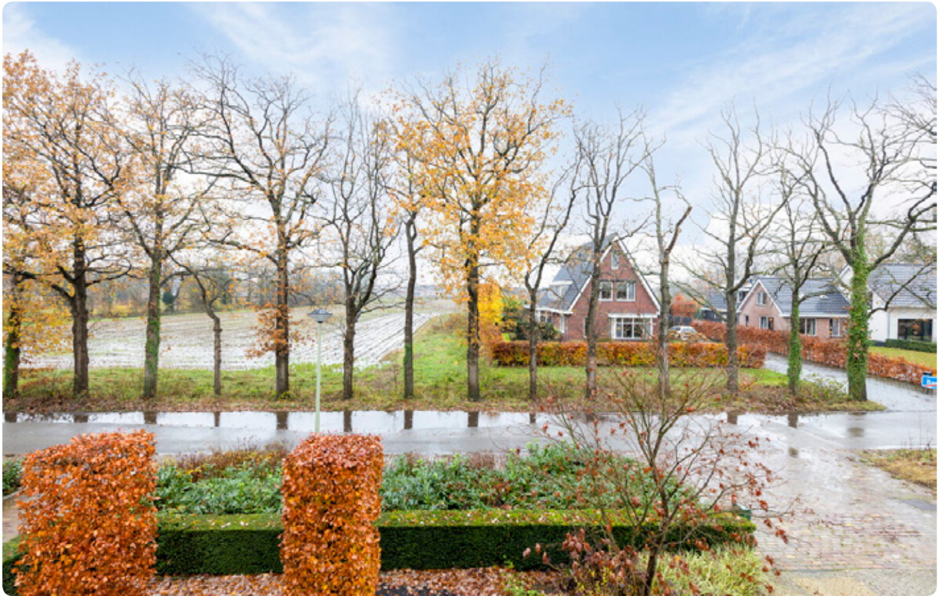
Prachtig uitzicht vanaf de loggia!