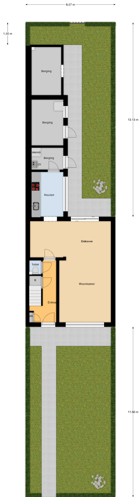
Begane Grond Tuin