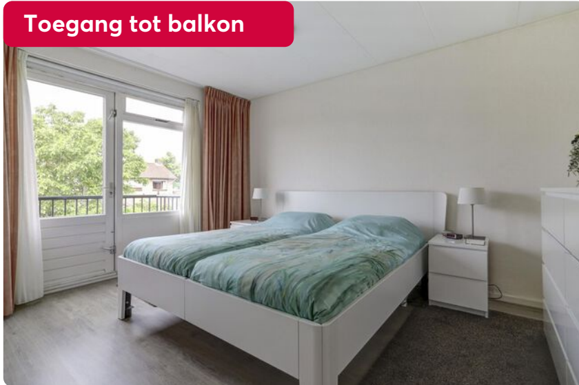
Toegang tot balkon