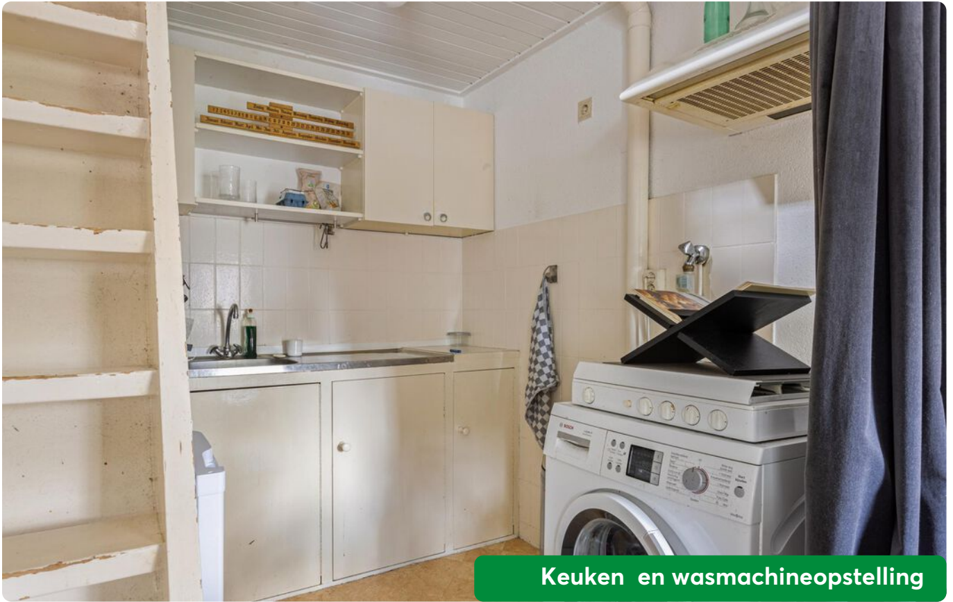
Keuken en wasmachineopstelling

Het tweede woongedeelte beschikt over een royale woonkamer met een vaste kast en een trapopgang naar de bovenliggende verdieping.