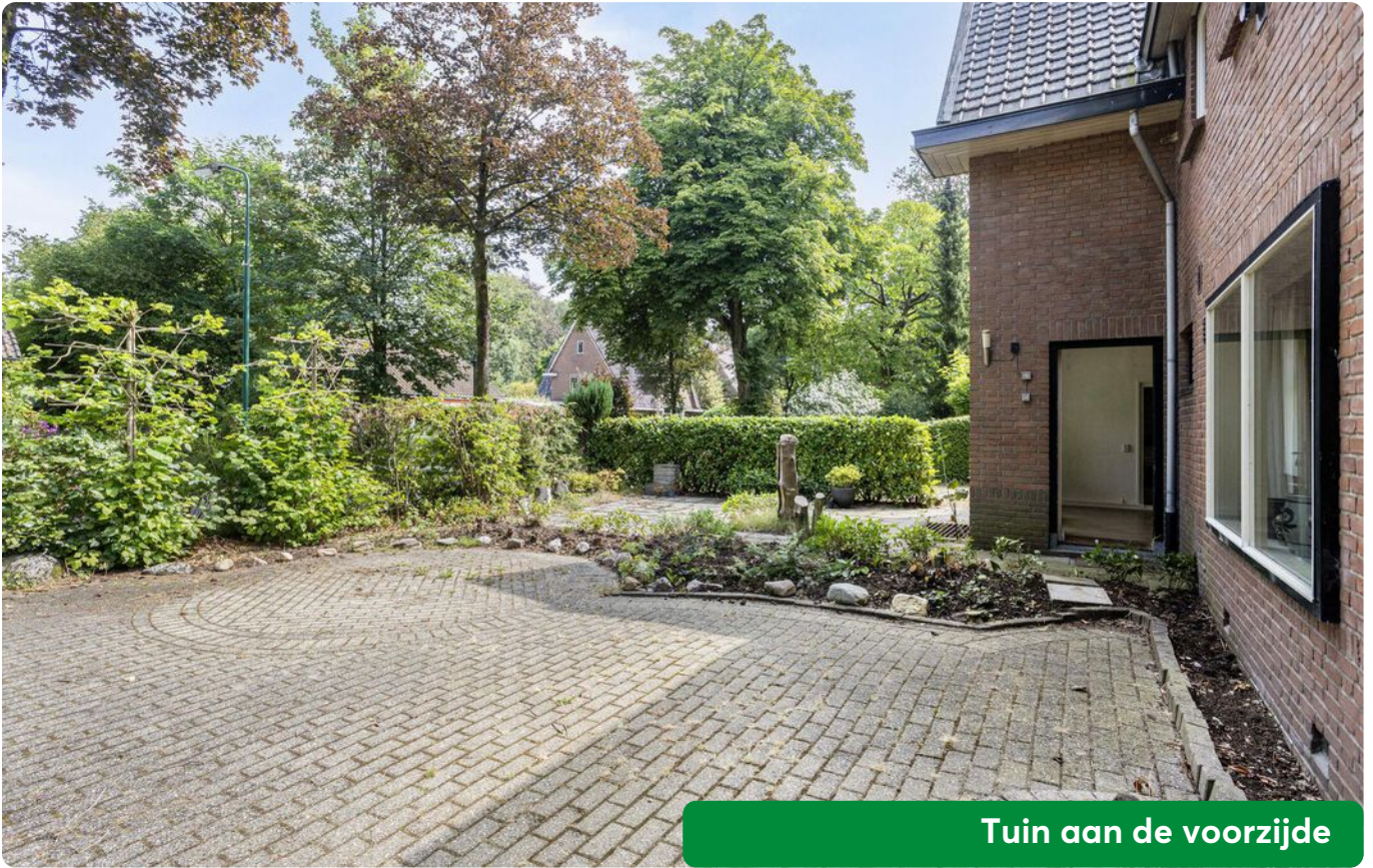
Tuin aan de voorzijde

De tuin is praktisch ingericht rondom de woning met straatwerk en gazon. Er is voldoende ruimte om uw auto op eigen terrein te parkeren. Daarnaast is er veel groen aanwezig, zodat u optimaal kunt genieten van de bosrijke omgeving.