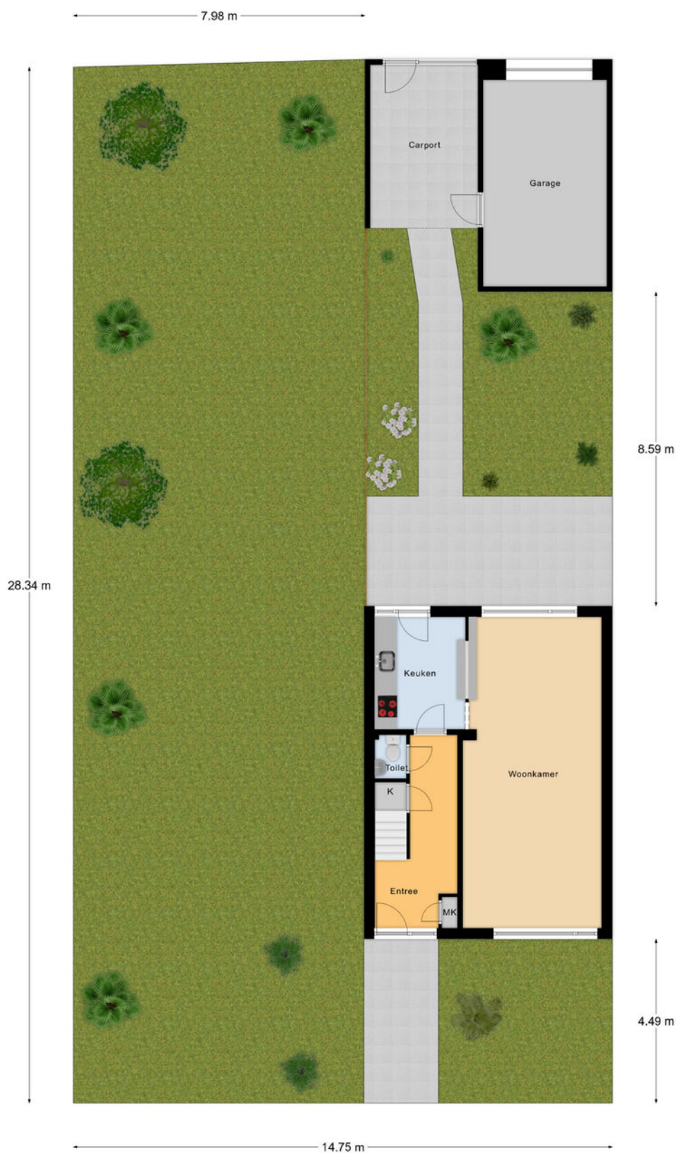
Begane Grond Tuin