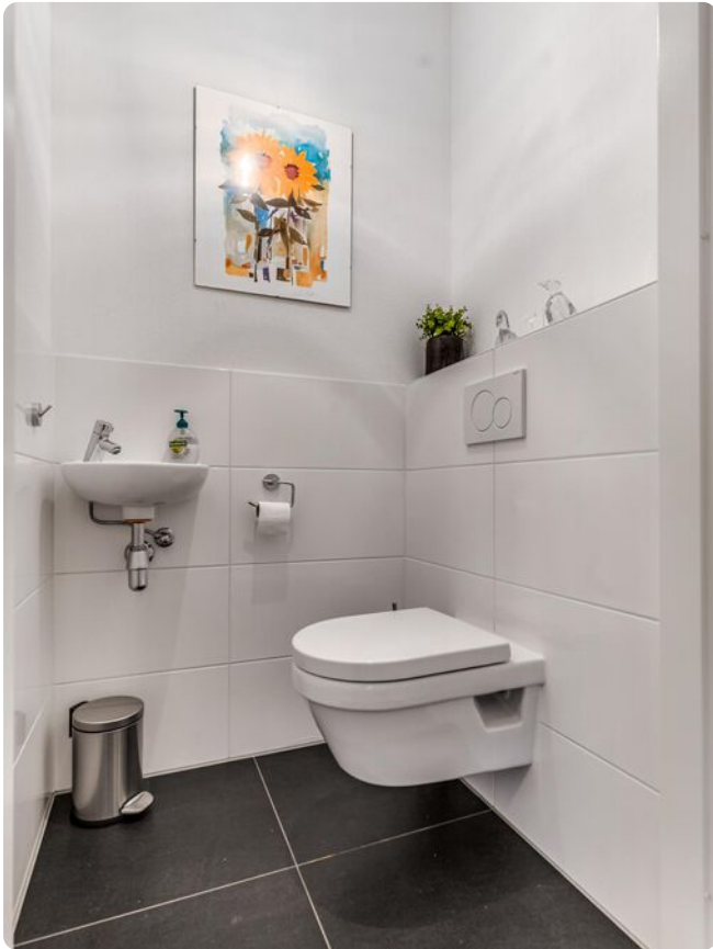
Toilet met fonteintje